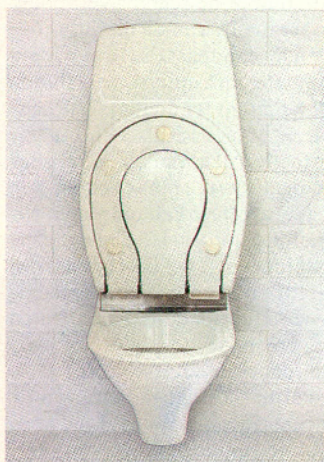
Dit toilet, een Duitse vinding met wereldpatent, hoeft bij gebruik nergens te worden aangeraakt: alles gaat met sensoren. De bril wordt automatisch van een brildekje voorzien.

De brildekjes bestaan uit 20 grams ongebleekt toilet papier, en voldoen aan Scandinavische milieu-eisen. Er passen twee