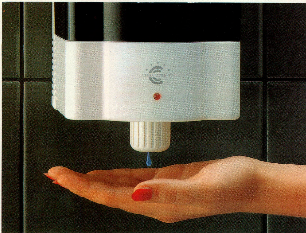
De Cleanhand is een zgn. no-touch zeepdispenser.

De beste manier om schone handen te houden op een toilet is niets aan te raken. Clean Concept uit Vianen komt een heel eind in het bereiken van dit ideaal. Zo levert men het Clean Closet, de Clean Hand en de Cleanfresh, resp. voor een hygiënische stoelgang, aanrakingsvrij handen wassen en automatische luchtverfrissing.